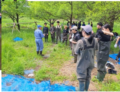
写真右＝講師に聞き入る学生たち