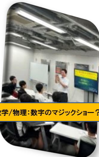
数学/物理：数字のマジックショー？