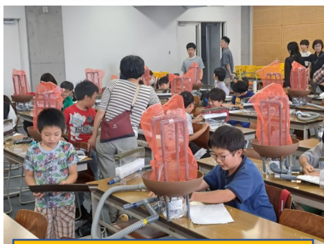
地学：実験やりながら自然災害の勉強