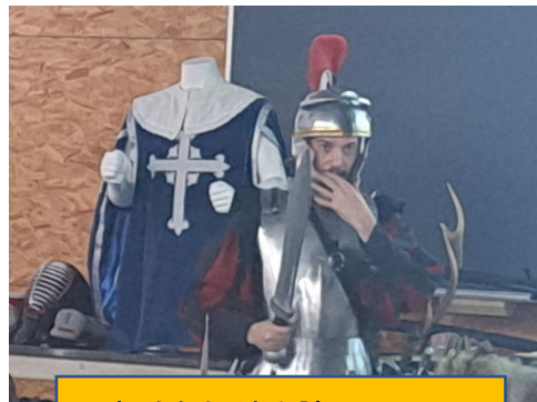
歴史：今年も現れた謎のフランス人