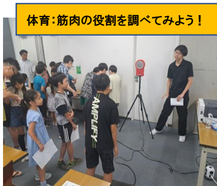
体育：筋肉の役割を調べてみよう！