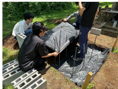
写真上＝コンクリートを流し込む作業