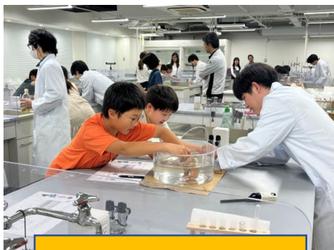
化学：酸とアルカリを分けてみよう