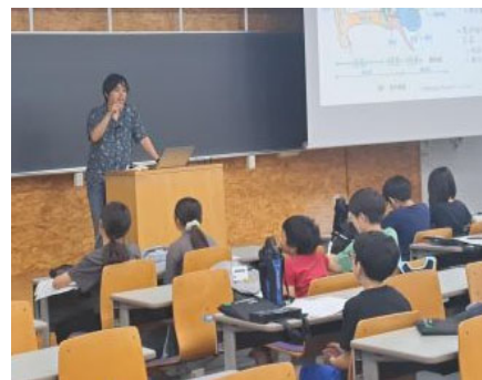
情報：数の仕組み音楽で聴いてみよう